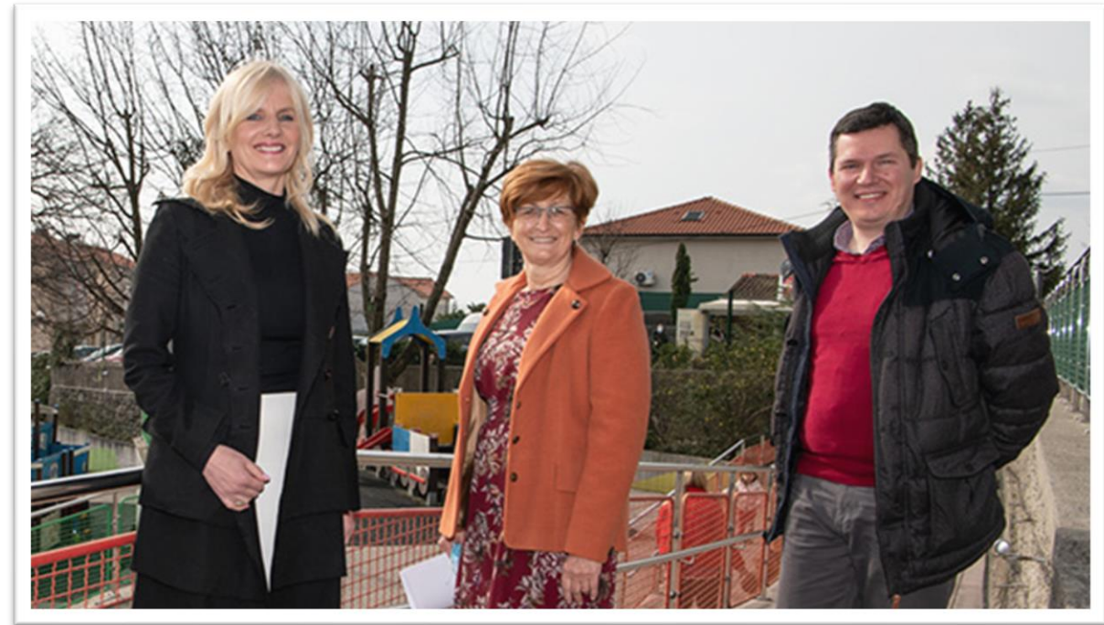
ESF+ project Croatia