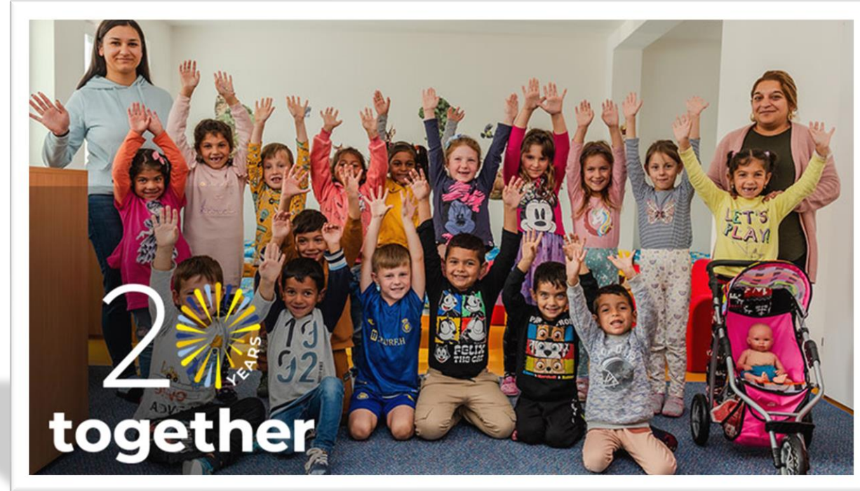
ESF+ project Slovakia