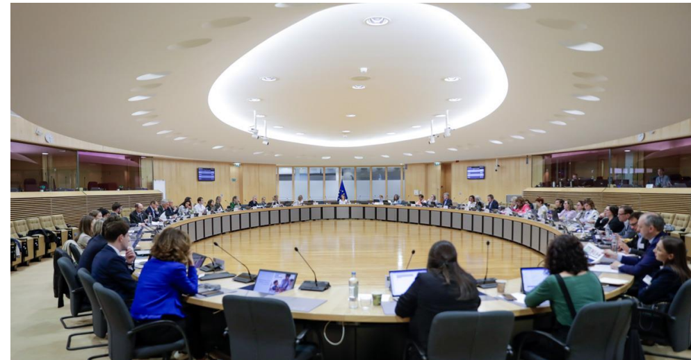
Meeting of the Child Guarantee Coordinators, June 2024